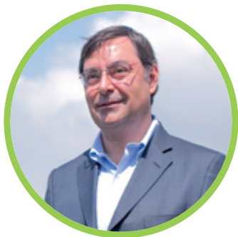
FELIPE GUEVARA STEPHENS ALCALDE DE LO BARNECHEA

“Nosotros creemos que abordar el tema del emprendimiento a una edad temprana es esencial para generar más y mejores emprendedores, que sean una contribución al desarrollo del país.”