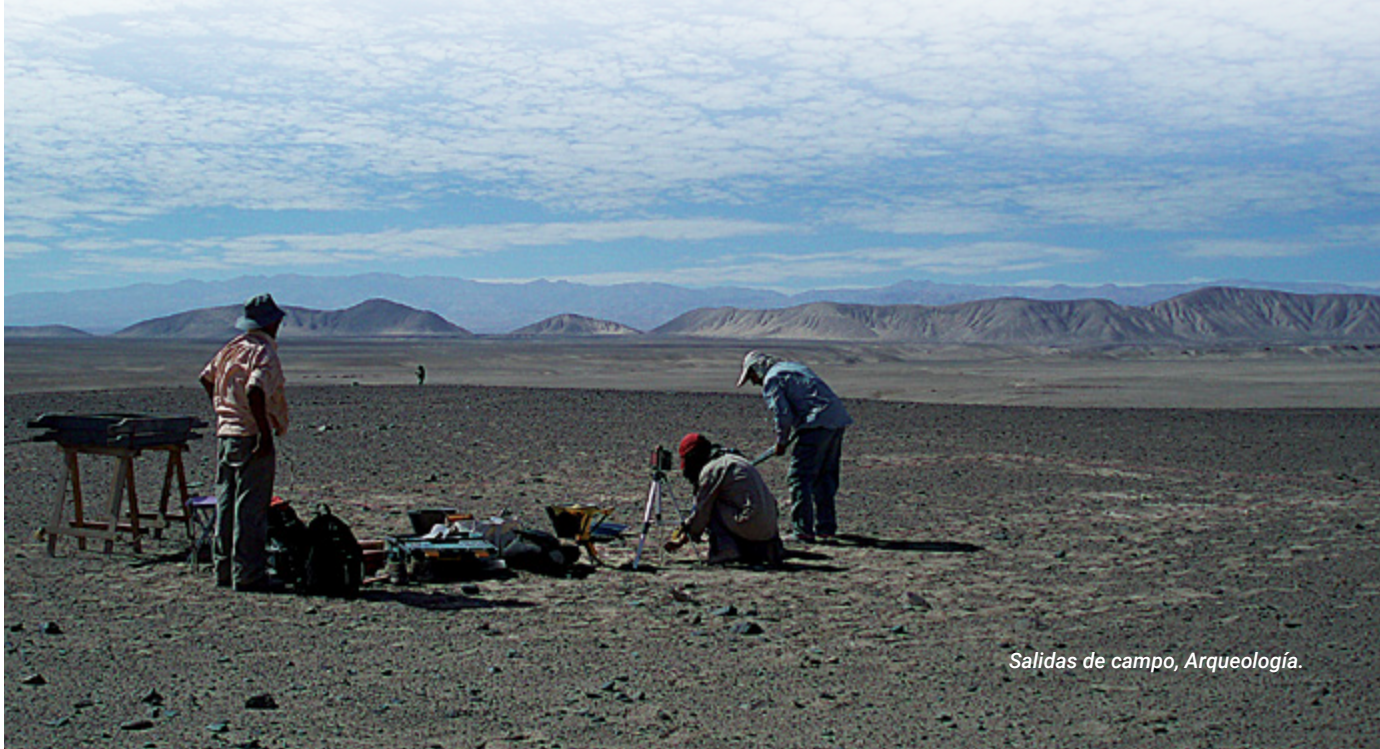
Salidas de campo, Arqueología.