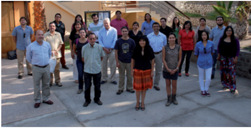
Equipo Humano CIHDE.