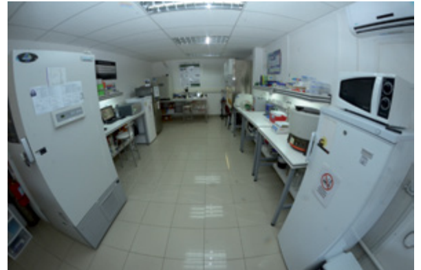
Laboratorio de Investigación e Innovación Biomédica (LIIB).

Confiamos en que nuestra región sea un polo de desarrollo, tanto en lo turístico como en lo productivo, ya que tenemos una macro zona que agrupa una población sobre los 20 millones de habitantes y un mercado internacional con alta demanda de conocer lugares únicos en el mundo, y productos regionales con valor agregado.