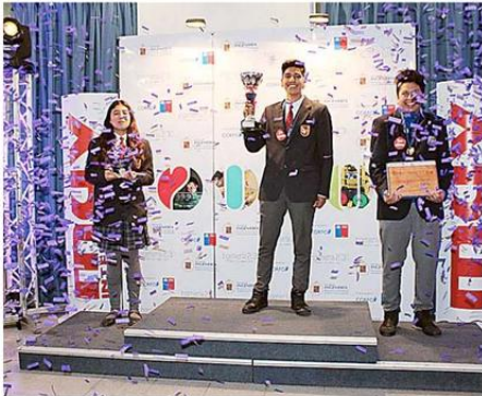
LOS TRES PRIMEROS LUGARES DEL CERTAMEN DE LA PUCV.