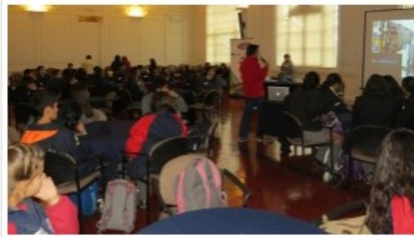
Más de 80 alumnos se dieron cita al encuentro realizado en Casa Central.

Durante dos días, más de 80 estudiantes tomaron parte en la primera etapa, de preparación, de este torneo, cuyos ganadores competirán en julio en el Torneo Nacional de Emprendimiento Escolar, donde intervendrán alumnos de al menos ocho regiones del país.